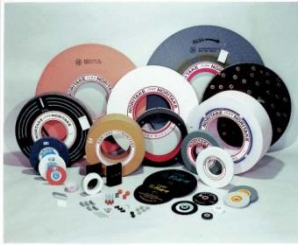
研削砥石 GRINDING WHEELS