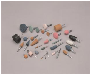
軸付砥石 MOUNTED POINTS