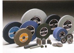
弾性砥石 PVA,FBB,UB WHEELS