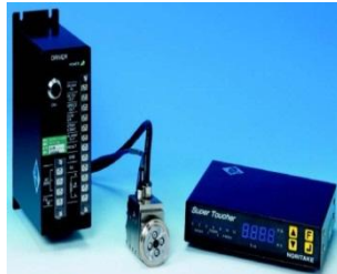
エンジニアリング装置 ENGINEERING DEVICES