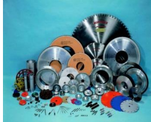
ダイヤモンド・CBN工具 DIA.CBN TOOLS