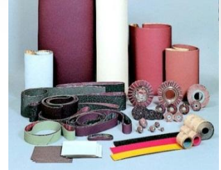
研磨布紙 COATED ABRASIVES