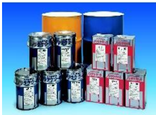
油性・水溶性クーラント液 防錆剤 Coolants